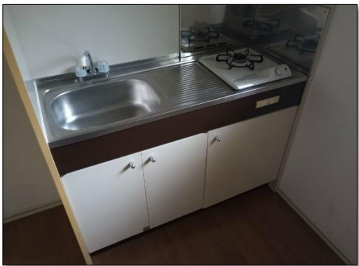
● 駅近物件 ● 風呂トイレセパレート ● キッチン一口ガスコンロ ● 下駄箱付き